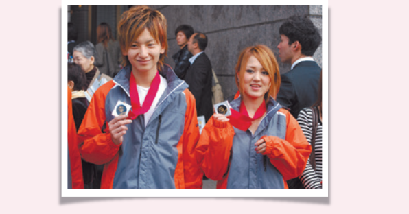
2012年 第50回技能五輪全国大会での競技の様子