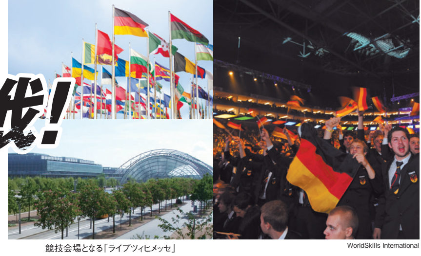
競技会場となる「ライプツィヒメッセ」